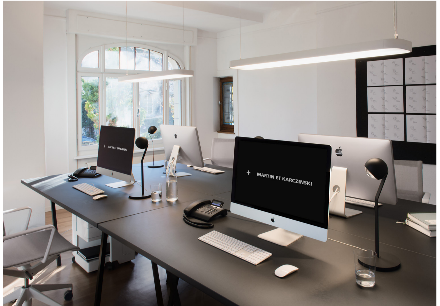
Agentur Martin et Karczinski, Zürich

Seit Bestehen der Agentur wurden 284 Awards gewonnen, unter anderem: ADAM Award in Gold, Silber und Bronze ADC Award Annual Multimedia Award Automotive Brand Contest Berliner Type Award Best of Corporate Publishing Corporate Design Preis DDC Award in Gold European Design Awards German Design Award Good Design Award iF communication design Award in Gold MfG Award PR-Bild des Jahres red dot design award (best of the best)